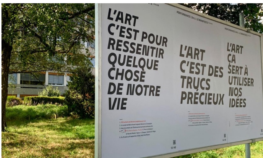
L'art de savoir ou du savoir l'art s'affiche ! / Vertigo / 5 min. / le 22 août 2024

Arts visuels, publié le 28 août 2024 Propos recueillis par Florence Grivel Adaptation web: Id